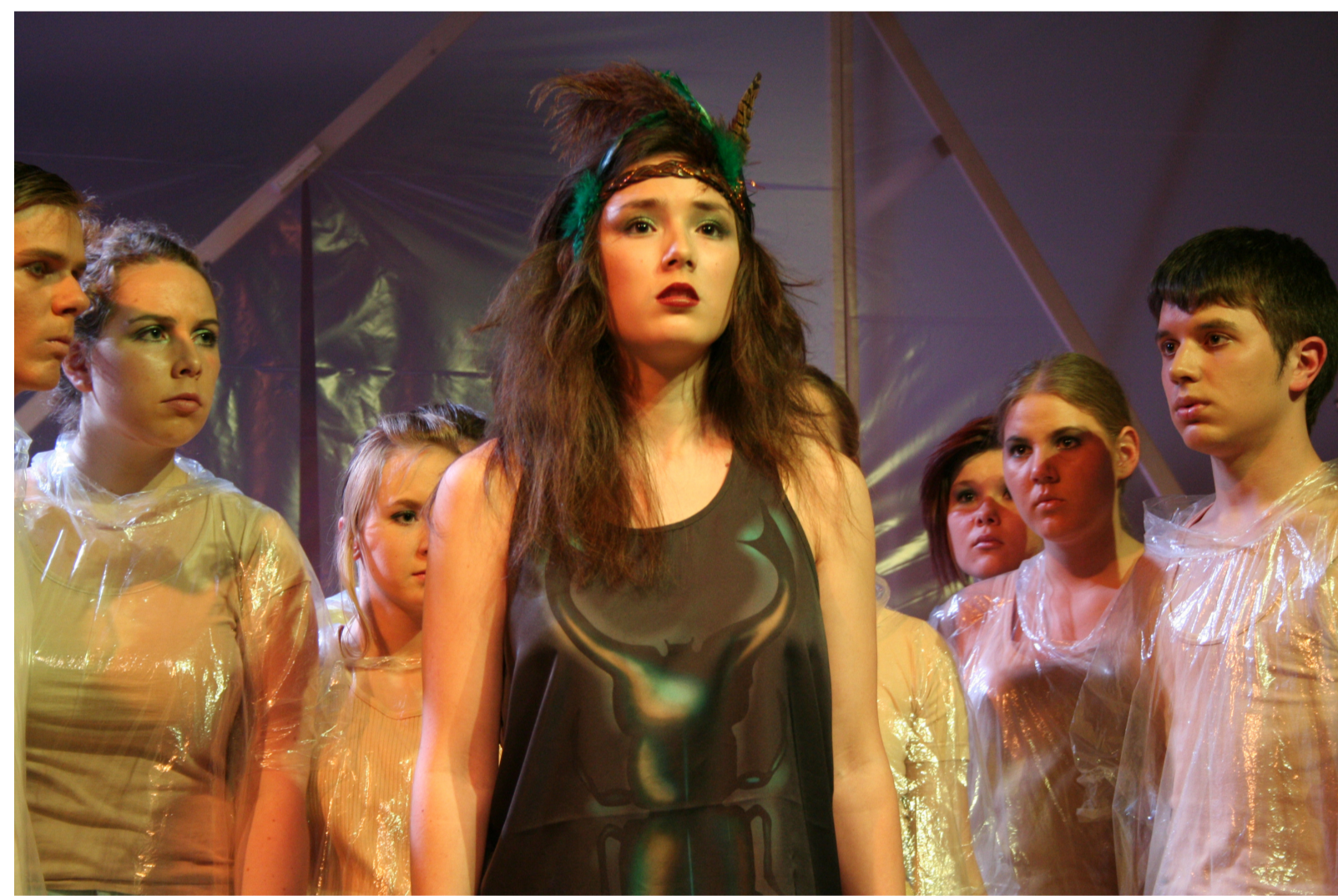
« Médée » d'après Euripide, par l'atelier-théâtre, 2011.

Durant le cursus de l'option Théâtre, il est possible de découvrir les processus de création théâtrale de l'intérieur et de se confronter à un public en participant à des projets divers, dont les spectacles annuels de l'atelier-théâtre du lycée.