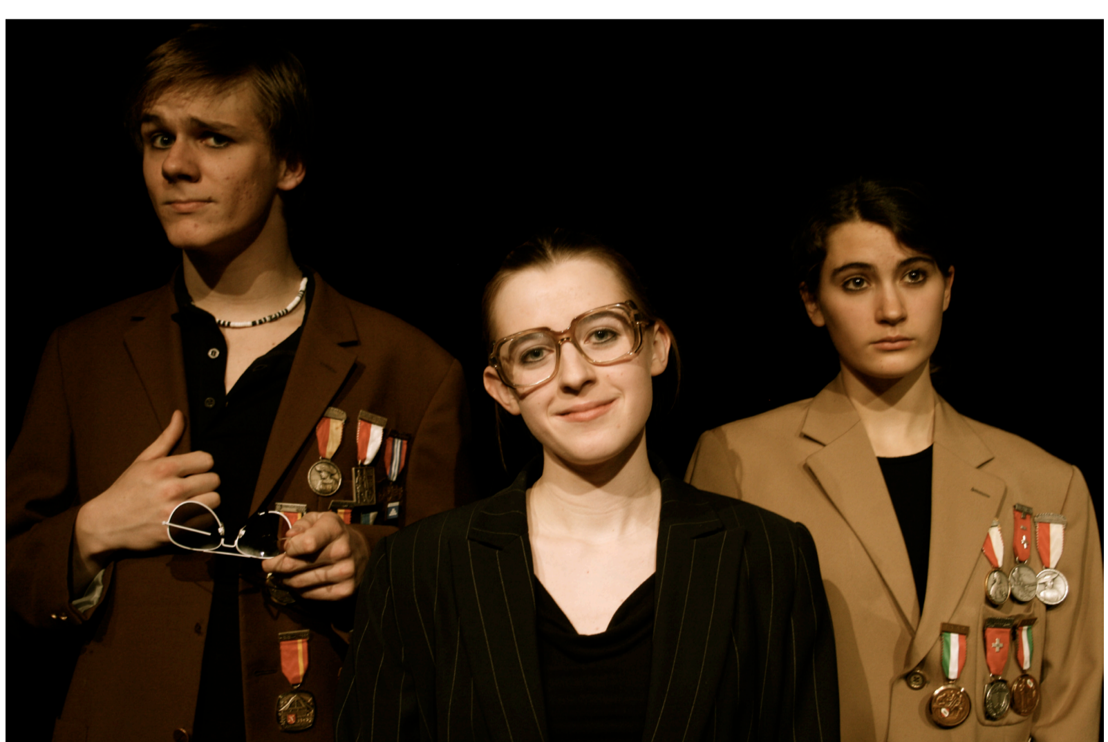
« Portrait d'une Planète » de F. Dürrenmatt, par l'atelier-théâtre, 2010.

Au-delà du savoir académique, l'option Théâtre met l'accent sur le développement global de la personne et l'acquisition de compétences clés dans le monde d'aujourd'hui : communication, créativité, sens des responsabilités, capacité de travailler en équipe, aisance en public, confiance en soi, esprit critique.