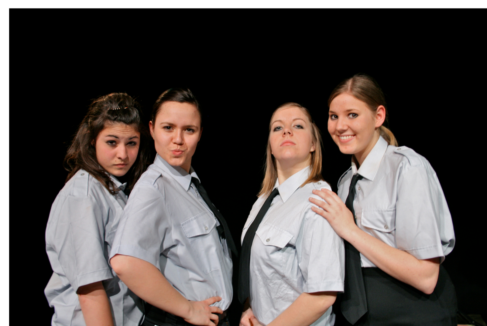
« Portrait d'une Planète » de F. Dürrenmatt, par l'atelier-théâtre, 2010.

L'option Théâtre vise un enseignement complet qui conjugue la théorie avec la pratique. Au programme : histoire du théâtre, analyse de spectacles, jeu et mise en scène, scénographie, production, lectures de pièces et textes fondateurs, écriture, discussions.